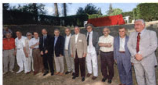
Foto di gruppo per le «Apifarfalla nel mondo» in ricordo della cerimonia di premiazione